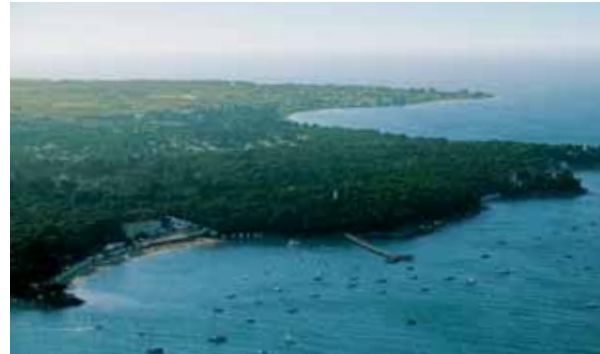
Île de Noirmoutier - France - Août 2006 Gilles Martin-Raget