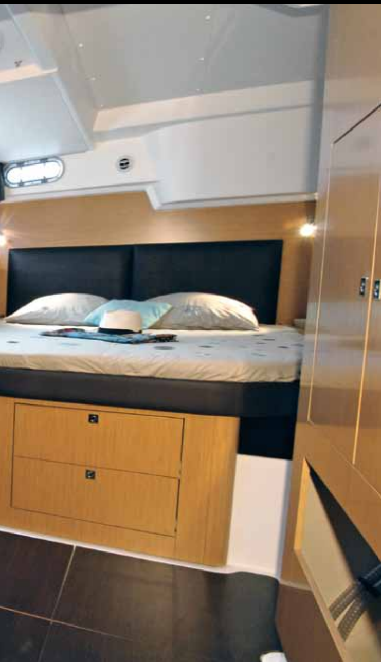
Versione Maestro: Una suite proprietario eccezionale