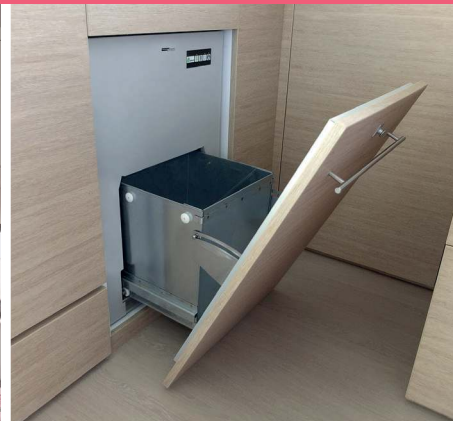
6 Waste compactor Compacteur à déchets