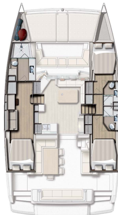
3 cabin version / 3 bath version Version 3 cabines / 3 SDB