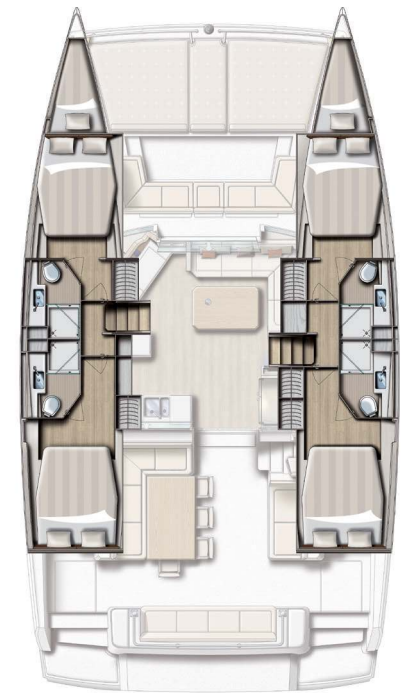
4 cabin version / 4 bath version with forepeacks fitted out (option) Version 4 cabines / 4 SDB + pointes avant aménagées (option)