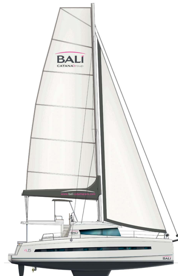
Helm station «on the flybridge» version Version poste de barre «sur le flybridge»