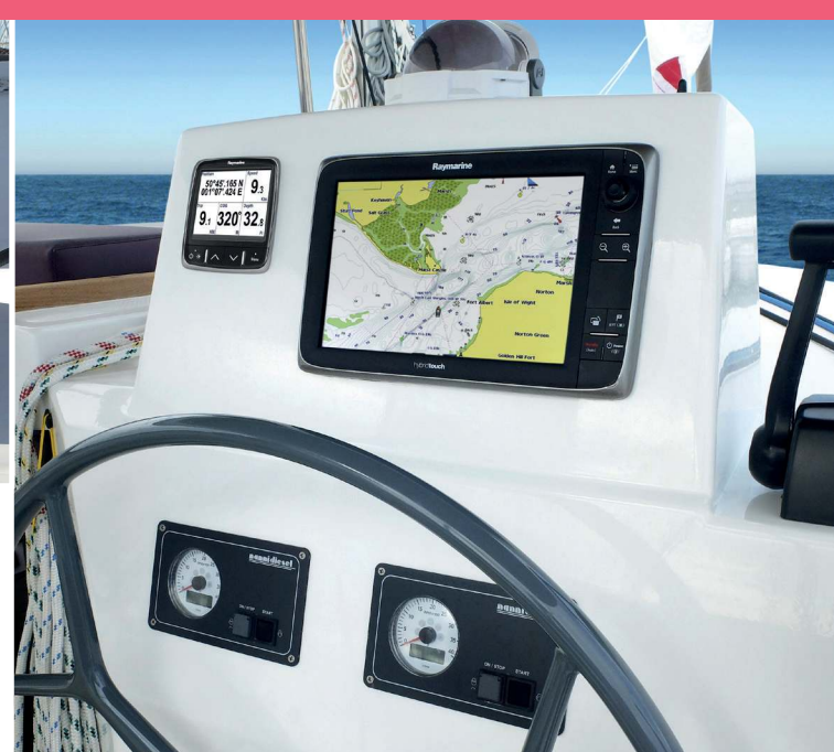
3 Full electronic equipment - composite steering wheel Electronique complète - Barre composite