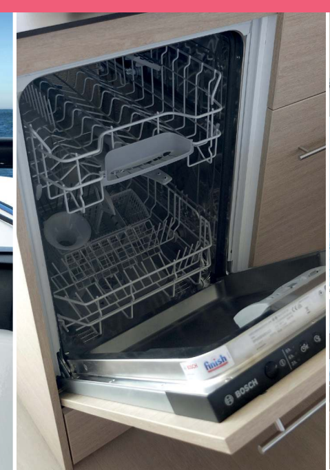
4 Dishwasher Lave-vaisselle