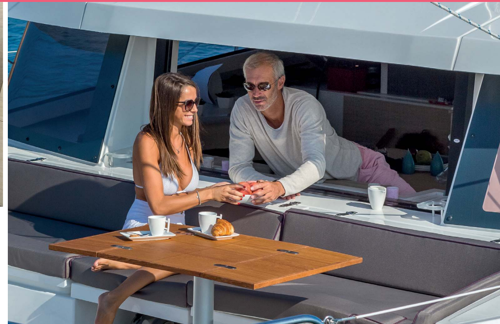
7 The large fully retractable window gives communication with the forward cockpit and ensure exceptional ventilation. La grande fenêtre entièrement escamotable permet de communiquer avec le cockpit avant et assure une ventilation exceptionnelle

Une sélection des meilleurs équipementiers d'accastillage de pont et de gréement ont participé à l'élaboration du BALI 4.5 Open Space en proposant des solutions innovantes, testées en laboratoire puis en mer. Pour vous proposer le meilleur de leur technologie associée à celle de BALI Catamarans.