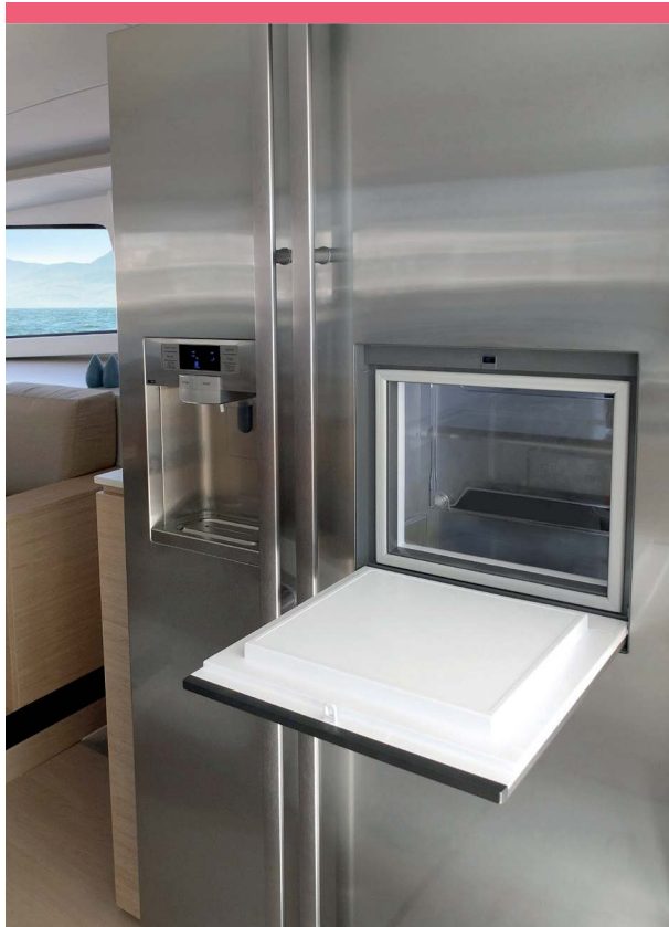
1 American fridge with ice-maker Réfrigérateur américain et distributeur de glaçons

Some of the best chandlers, riggers and deck equipment suppliers have been involved in the BALI 4.5 Open Space, providing innovative solutions, tested both in the lab and at sea, to give you the best their technology.