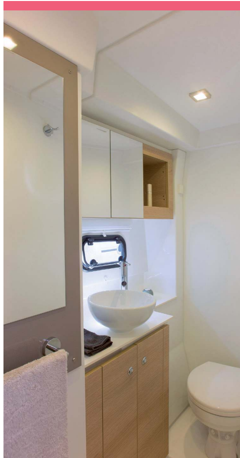
Guest bathroom and cabin Salle d'eau et cabine invités