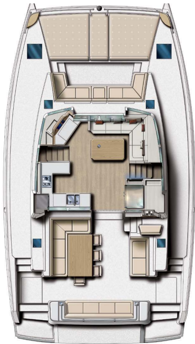
Platform Layout Plan de Nacelle