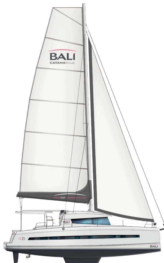
Helm station «BIMINI» version Version poste de barre «BIMINI»

* Equipment according to chosen Pack and options / Equipement selon Pack et options choisis