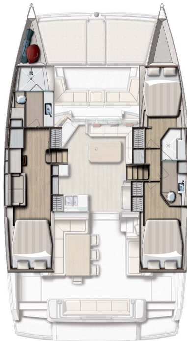
3 cabin version / 2 bath version Version 3 cabines / 2 SDB