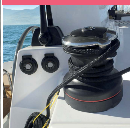
2 Electric winch Winch électrique