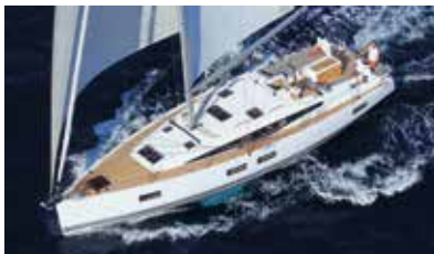
Jeanneau Yachts Luxury and ocean sailing Luxe et grande croisière