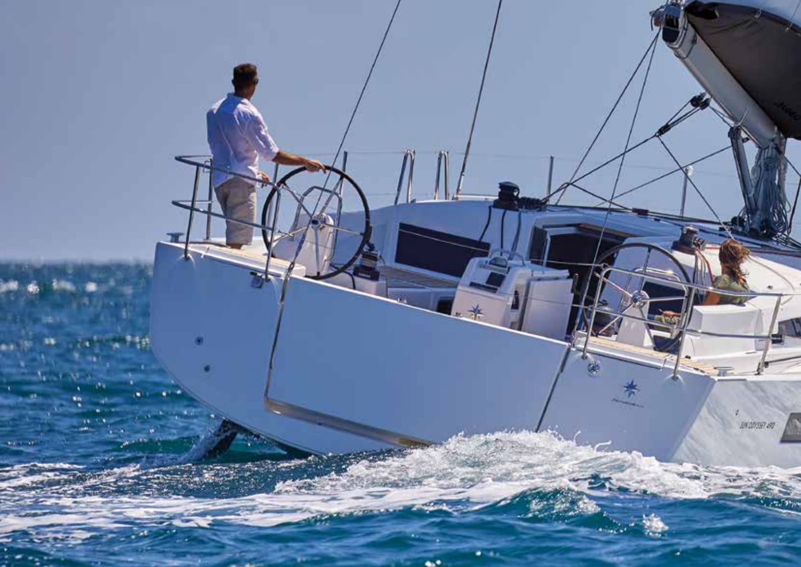
► Comfortable and functional cockpit Cockpit confortable et fonctionnel Komfortables und funktionelles Cockpit Carlinga confortevole e funzionale Cómodo y funcional pozzetto