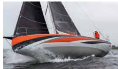
Sun Fast Race short-handed or with crew Course en solitaire comme en équipage