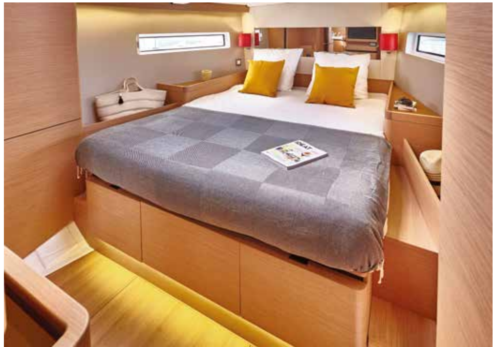
▲ High standard master cabin Cabine propriétaire de haut standing Eignerkabine mit hohem Standard Cabina propietario de alta gama Lussuosa cabina armatoriale