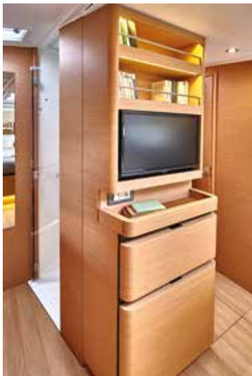
▲ Many spaces of storage and a private head Nombreux rangements et une salle de bain privative Viel verfügbarer Stauraum und ein Privates Waschräume Muchos espacio de almacenaje disponible y un privato baño Molteplici scomparti e armadietti e uno privato bagno