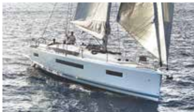
Sun Odyssey Elegance and performance Élégance et performance

Discover all these and more at www.jeanneau.com , or at your local Jeanneau Dealership.