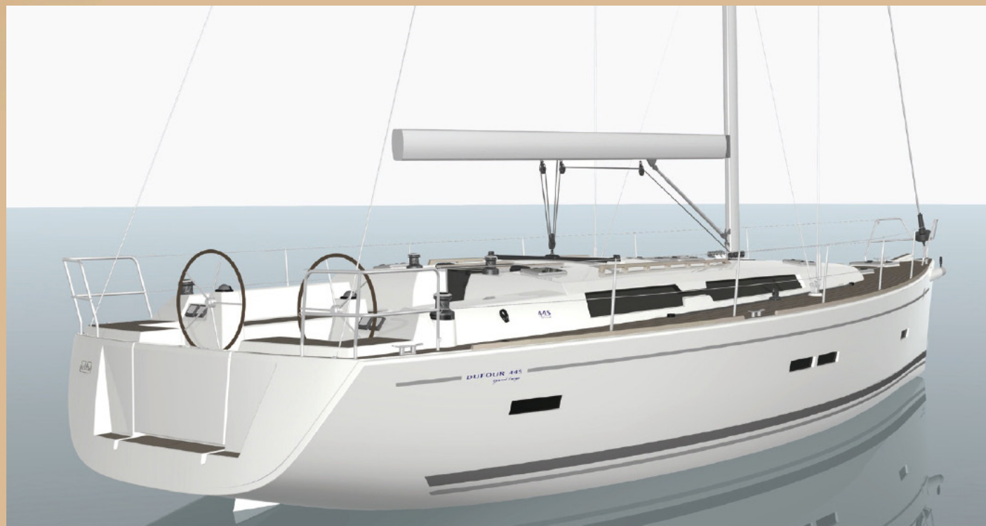
DUFOUR | 445 Grand'Large